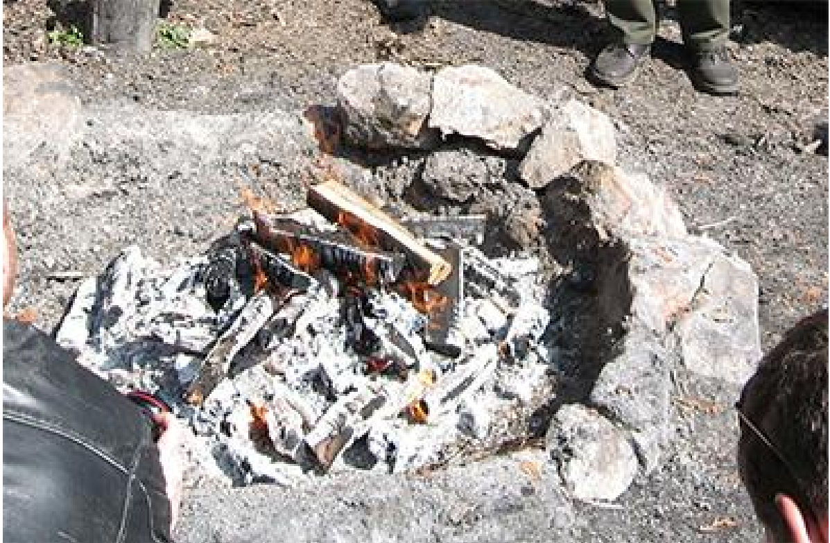
Tűzgyújtásra kijelölt tűzrakó hely

Az erdőgazdálkodók a parkerdők területén turisztikai célból tűzvédelmi szempontból állandó és biztonságos tűzrakó helyet kötelesek kialakítani . A kijelölt tűzrakó helyet az erdőgazdálkodó kötelessége karbantartani, illetve az erdő tűz elleni védelmével kapcsolatos feltételek megteremtéséről gondoskodni. A kialakított tűzrakó helyen a tűzvédelmi rendelkezések betartásával bárki jogosult tüzet rakni.