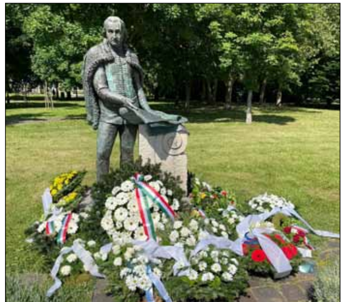
Koszorúzás - Gödöllő